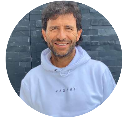
Luis Milla Seleccionador Nacional de Indo- nesia, Entrenador en C.D Lugo, Entrenador Real Zaragoza y seleccionador Nacional de España Sub 19 y Sub 21.